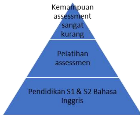
Gambar 1. Hasil Angket Pengalaman Mengajar Guru

Guru-guru yang mengikuti pelatihan ini setuju dan sangat setuju untuk berfokus pada aspek pada komponen bahasa pada paragraf dan memilih metode penilaian writing yang sesuai sebesar 75%.